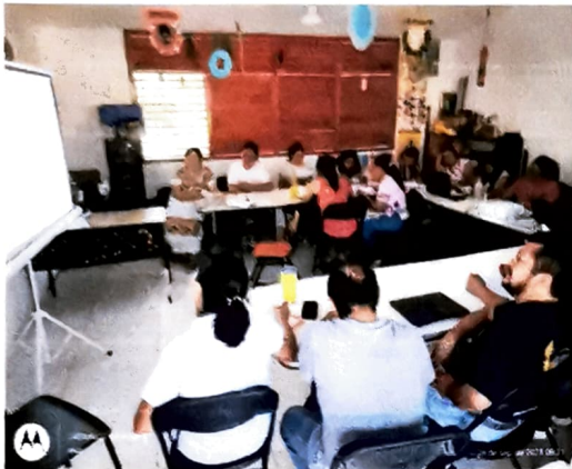
Foto 1.- análisis del programa de mejora continua y es analizada en colectivo con las docentes.