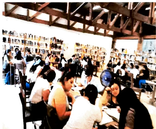
Foto 2.- el consejo técnico escolar con la participación de las practicantes de la normal para educadoras que realizan sus prácticas en los centros escolares. analizando en comunidades de aprendizaje las problemáticas de cada centro.