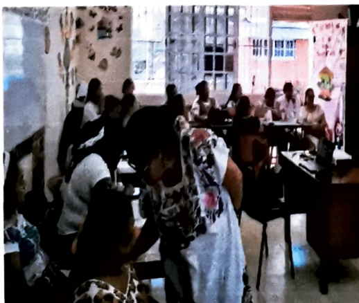
Foto3.- la supervisora revisando y orientando en un consejo técnico sobre el plan analítico de cada centro de trabajo.

A handwritten signature or mark, possibly a checkmark or a stylized signature, is located in the bottom right corner of the page.