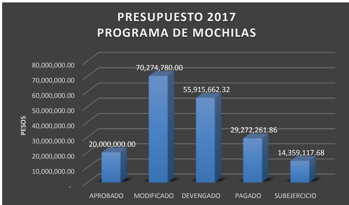
Gráfica 4.- Análisis por Clasificación funcional