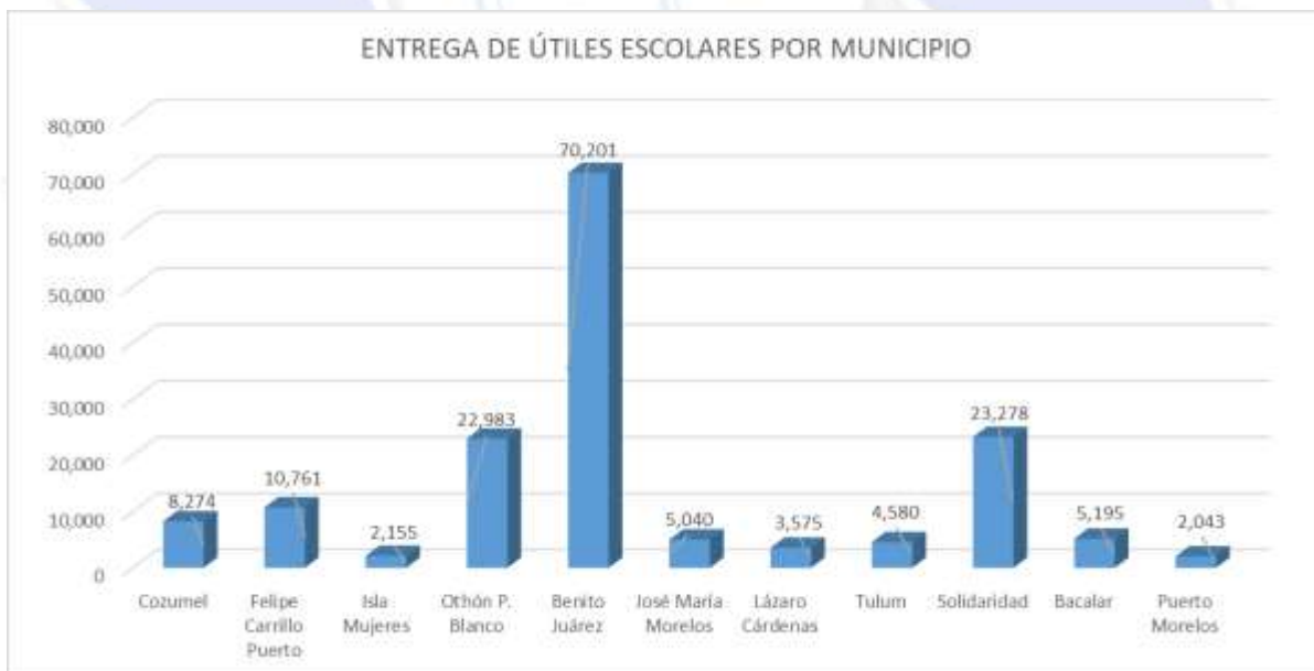
Gráfica 3.- Distribución de paquetes de útiles escolares por municipio