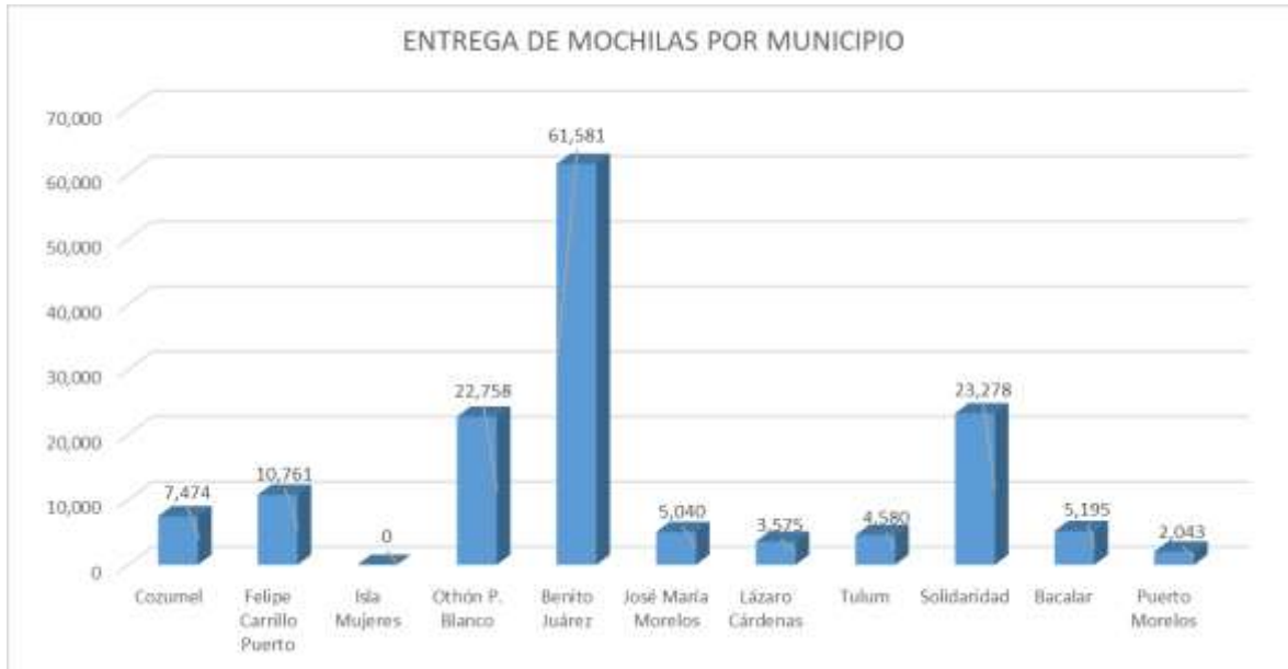
Gráfica 2.- Distribución de paquetes de mochilas por municipio