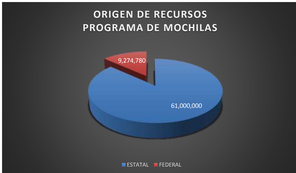
Gráfica 5.- Análisis por el origen de los recursos