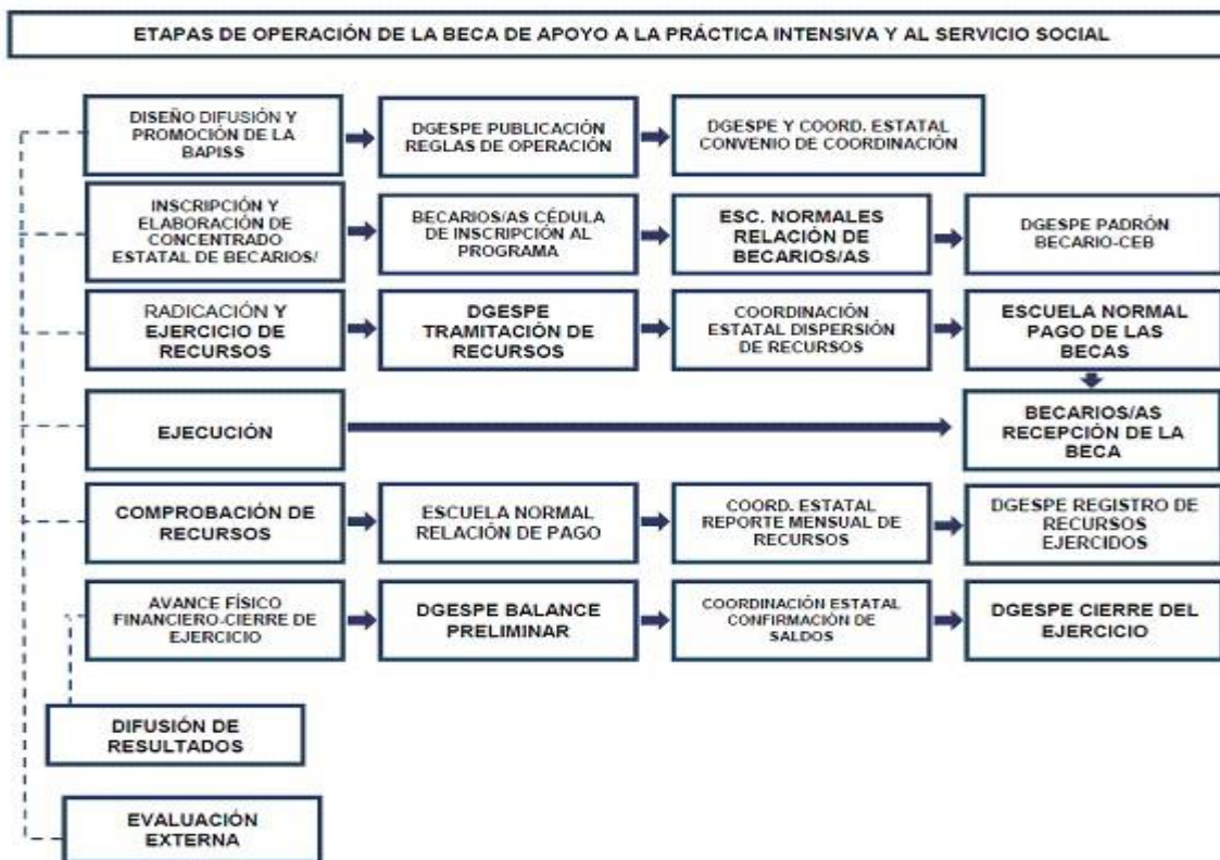
Figuran 2. Etapas de operación de la beca.