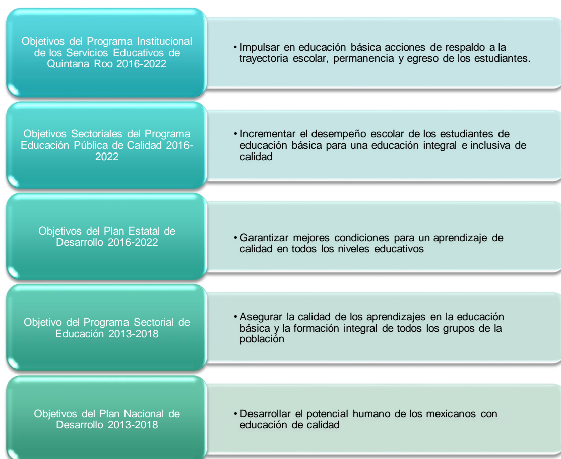
Figura 1. Alineación Estratégica