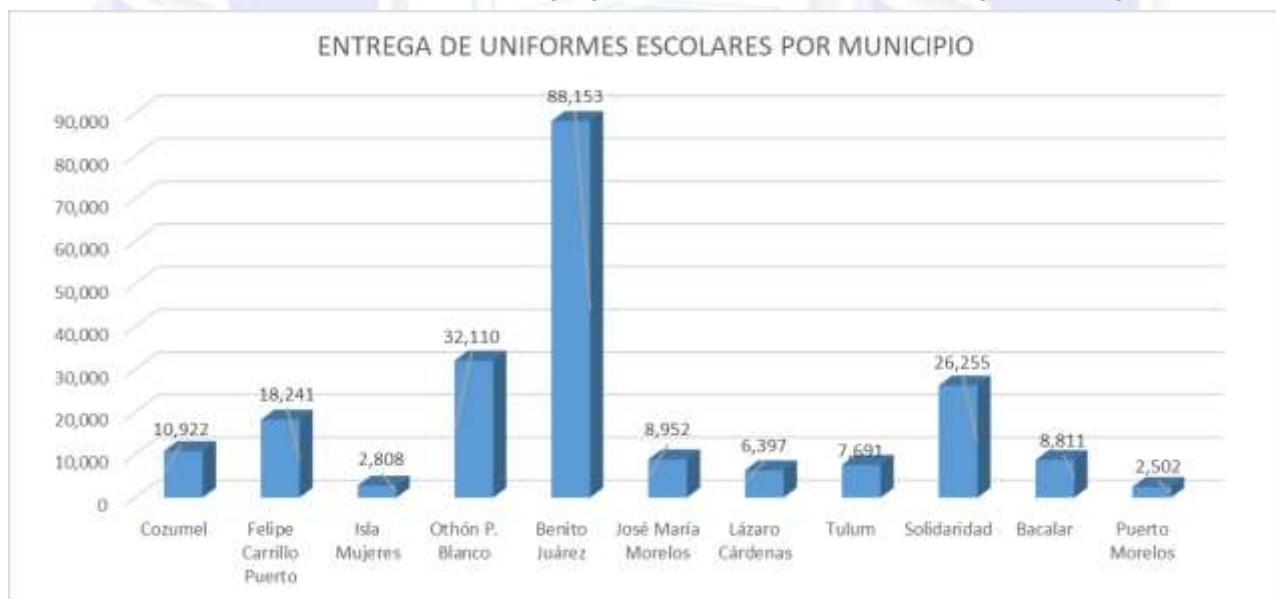
Gráfica 1.- Distribución de paquetes de uniformes escolares por municipio 2

Durante el ciclo escolar 2017-2018, se realizó la dotación de 212,842 paquetes de uniformes escolares gratuitos con los que se beneficiaron a igual número de alumnos de nivel primaria de la modalidad general e indígena del estado de Quintana Roo.