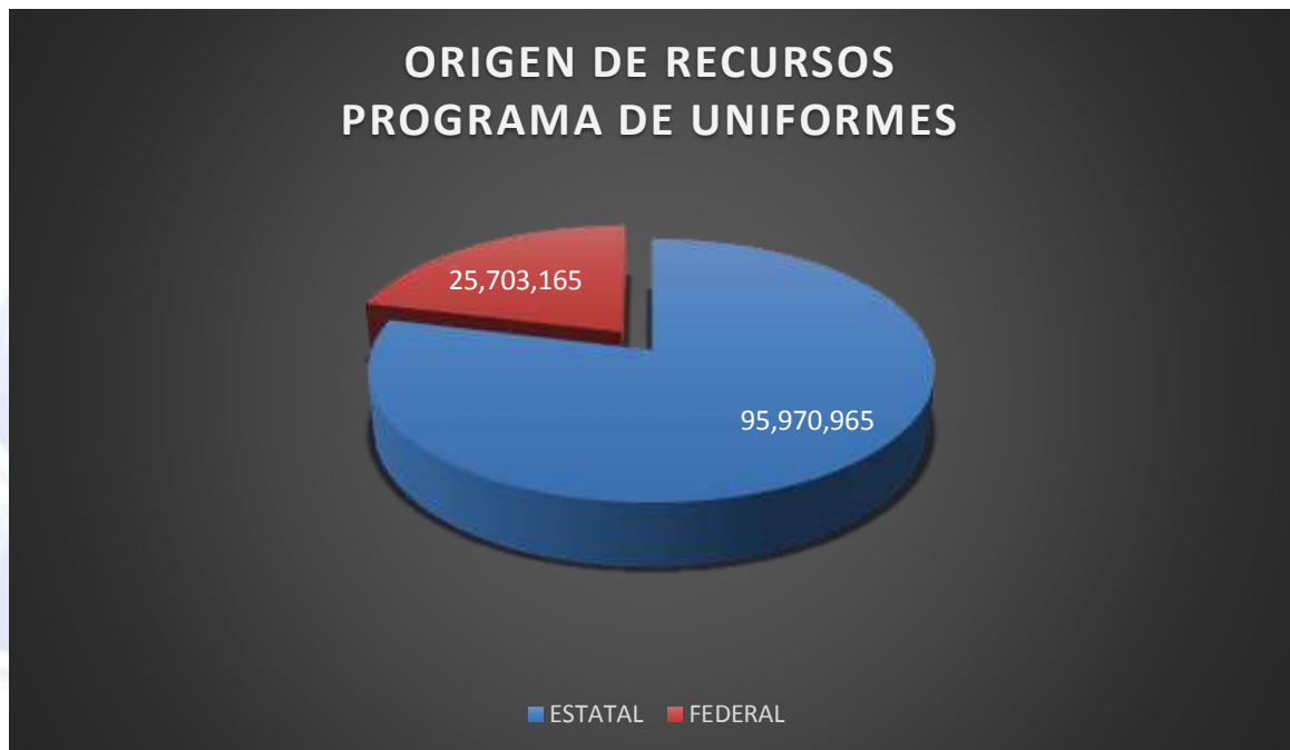
Gráfica 3.- Análisis por el origen de los recursos