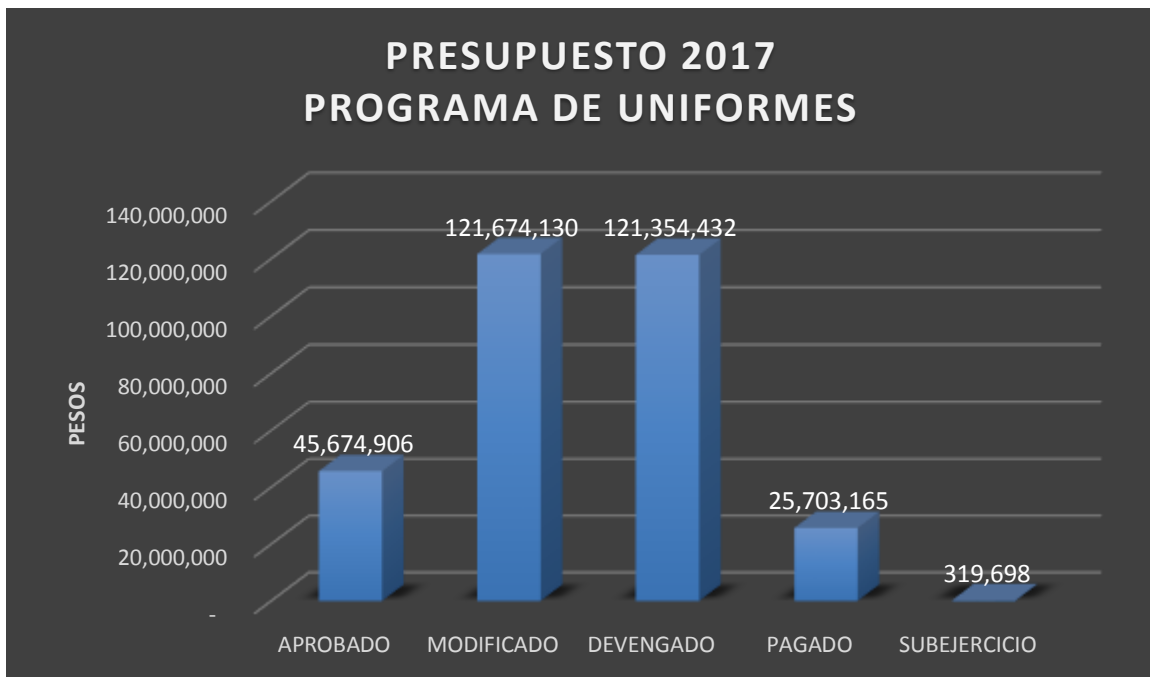
Gráfica 2.- Análisis por Clasificación funcional